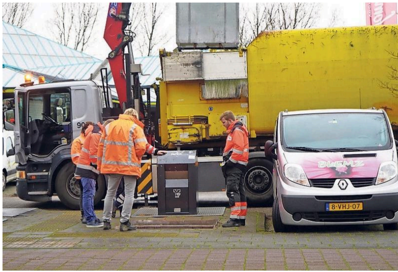
Medewerkers van HVC bekijken het drie meter diepe gat.