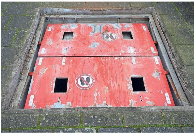
Het luik van de ondergrondse container.

Daarbij raakte de man gewond. Het incident vond plaats winkelcentrum Dorperweerth.