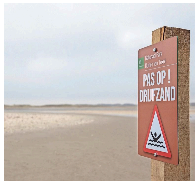
Vanwege de recente incidenten zijn de waarschuwingsschilden rond het drijfzand vervroegd teruggeplaatst.

„Verdwijnen in drijfzand kan alleen in de film. Maar uit vermoeidheid kun je wel verdrinken als je geen hulp krijgt”, aldus de boswachter.